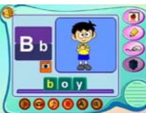
Fun with ABC