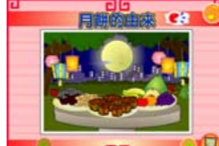
精選推介 (多媒體故事)