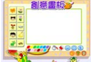
填色冊及創意畫板