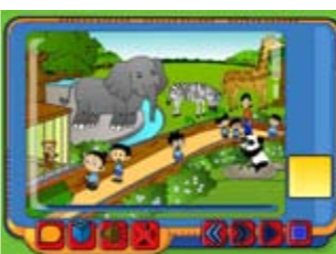
Fun Fun Themes Land