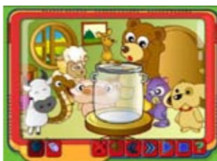
Fun Fun Story Land